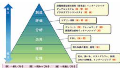
マネジメント分野学習のタキノミー